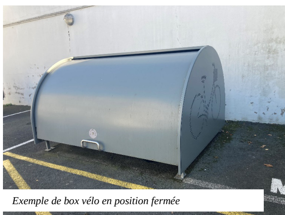
Exemple de box vélo en position fermée

Mais dans le quotidien trépidant des familles, un point nous a paru intéressant à réfléchir. Si personne ne compte se passer du bus scolaire utilisé quotidiennement par les écoliers, que se passe-t-il entre nos domiciles et le réseau d'abris bus où nous déposons nos enfants le matin et que nous récupérons le soir ?