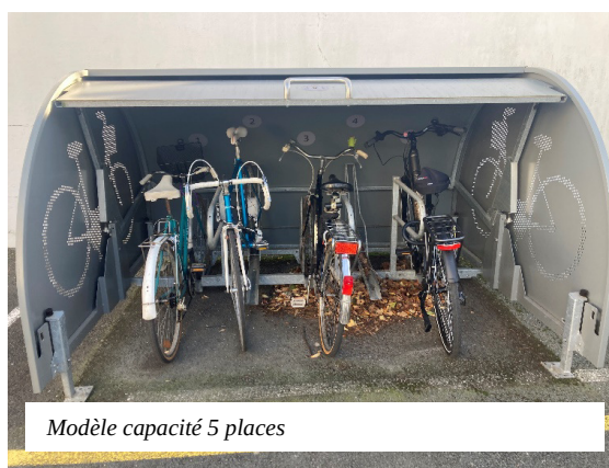
Modèle capacité 5 places

Nous vous suggérons l'idée d'implanter, à priori en premier lieu, une box vélo au niveau de l'abris bus du bourg à côté de la mairie, un box vélo. Le principe est de pouvoir déposer à l'abri un vélo, de pouvoir l'attacher dans de bonnes conditions et même de pouvoir limiter l'accès à la box via une fermeture à clef.